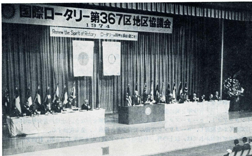
国際ロータリー第367区地区協議会