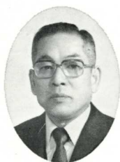
香川分區 山西 齊(高松東)