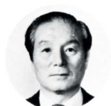
尾 部 輝 光